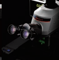
小量具和数据管理系统