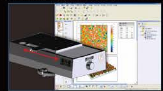
三次元表面粗糙度测量