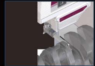
普通 / 横向测量